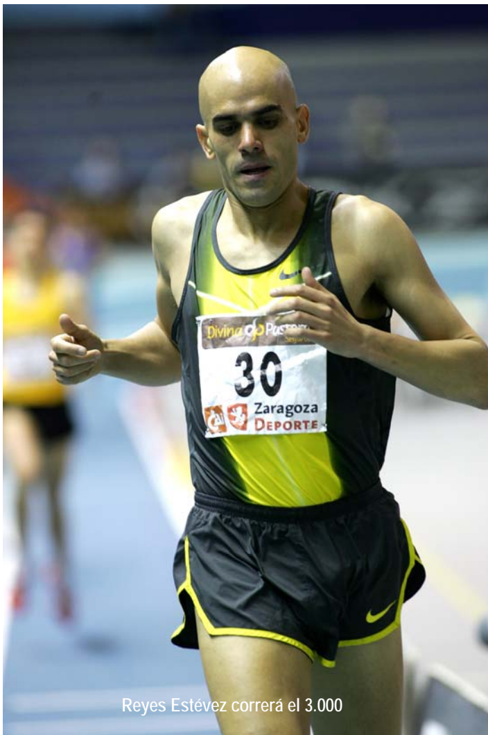
Reyes Estévez correrá el 3.000

campeón mundial de 3.000 obstáculos en Osaka y subcampeón olímpico en Atenas o los españoles Reyes Estévez, Antonio David Jiménez "Penti" y Javier Alves.