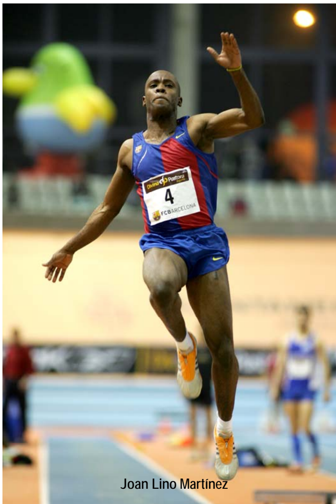
Joan Lino Martínez