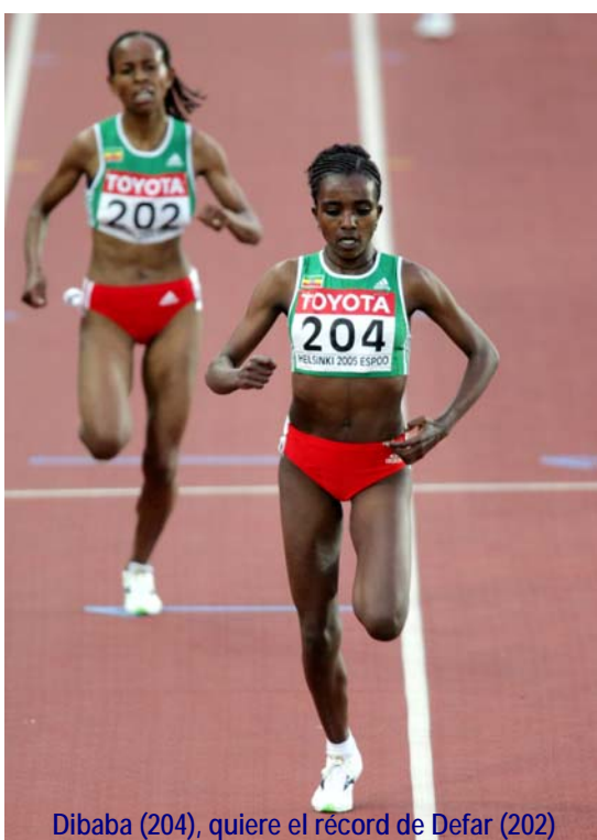
Dibaba (204), quiere el récord de Defar (202)

En la partida también juegan el portugués Rui Silva, que es una máquina de lograr medallas para su país, el keniano Daniel Kipchirchir, vigente subcampeón mundial de 1.500 bajo techo; el también keniano Brimin Kipruto,