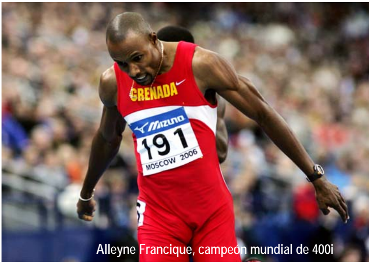
Alleyne Francique, campeón mundial de 400i